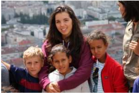
Un après-midi à la Bastille